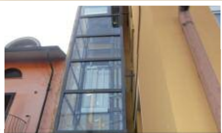
Barriere architettoniche: finalmente l'ascensore alle Scuole Elementari Castelrosso e Marconi