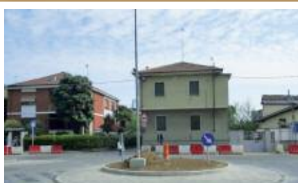
Come richiesto da molti cittadini, si mette in sicurezza la viabilità di via Mezzamo