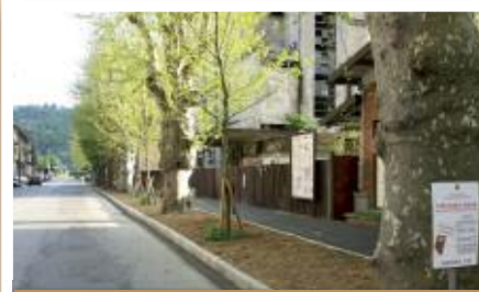
Finalmente il camminamento pedonale in via Po