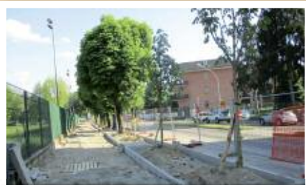
Nuovi alberi e nuovo marciapiede in viale Cavour davanti alla materna