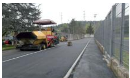
Dalla vecchia gradinata, si ricava una nuova pista di riscaldamento al "Paolo Rava"