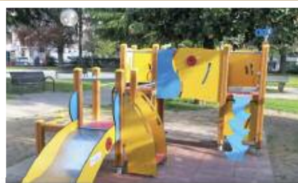
I nuovi giochi nel giardino di via Po