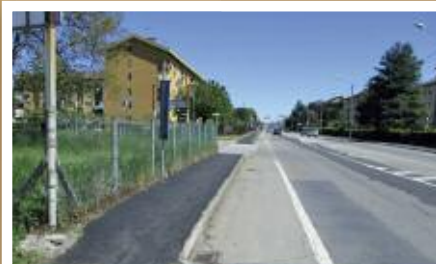
Sistemato il marciapiede di corso Galileo Ferraris