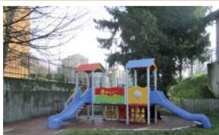
Nuovi giochi alla materna "Bambi" di viale Cavour