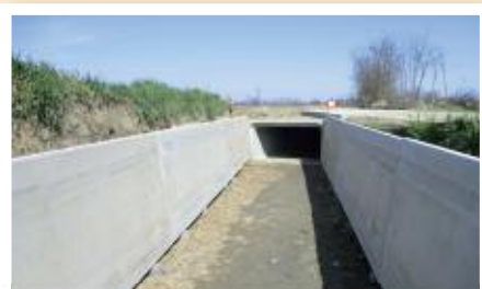
Via Chiabotti - strada della Valsesa sistemazione canali idrici ed incrocio