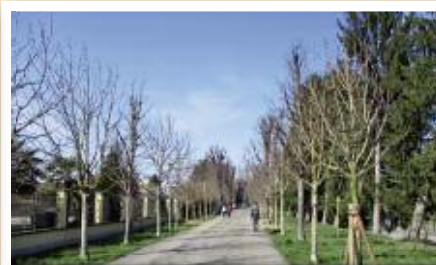
Sostituite le piante malate nello storico viale del Canale Cavour