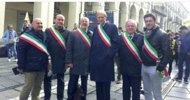
21 marzo 2016 Torino: manifestazione per le Vittime della Mafia

Fa' la cosa giusta rimanendo a fianco dell'Amministrazione perché molto è ancora il lavoro da fare. La nostra Amministrazione vuole essere sempre più inclusiva, senza però disconoscere le proprie idee e valori, che superano innanzitutto il personalismo fine a se stesso a cui eravamo abituati.