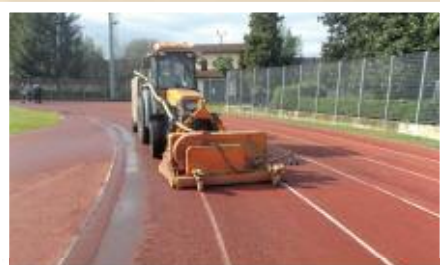
Completamente rifatta la Pista d'atletica al "Paolo Rava"