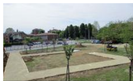
Iniziati i lavori al Nadone per un nuovo parco giochi