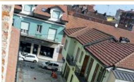
Riqualificazione ambientale: anche in via Defendente Ferraris pavimentazione nuova