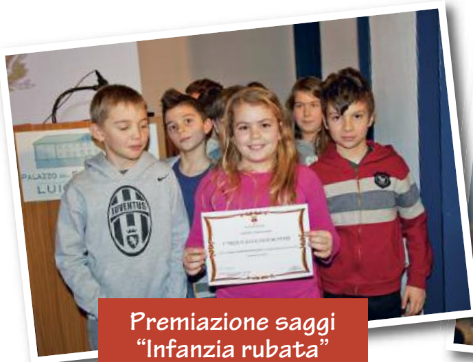
Premiazione saggi "Infanzia rubata"

Assessore alla Cultura, Turismo, Sport e Tempo Libero, Istruzione, Volontariato e Associazionismo